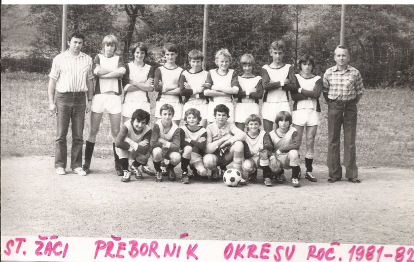
ST. ŽÁCI PŘEBORNÍK OKRESU ROČ. 1981-82