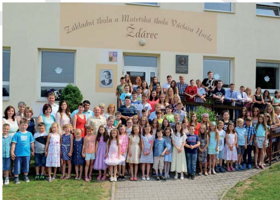
Základní škola Václava Havla Žďárec 2017 - 2018